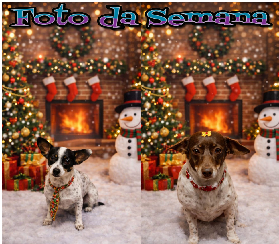
Bob e a Bolinha curtindo o Natal.